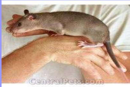
Gambian giant rat