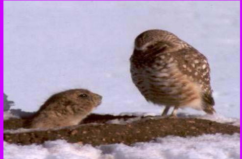
Prairie dog & owl